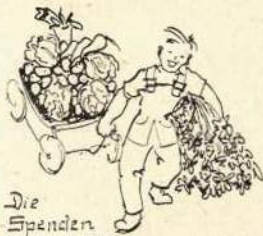
Die Spenden unserer Gärtner